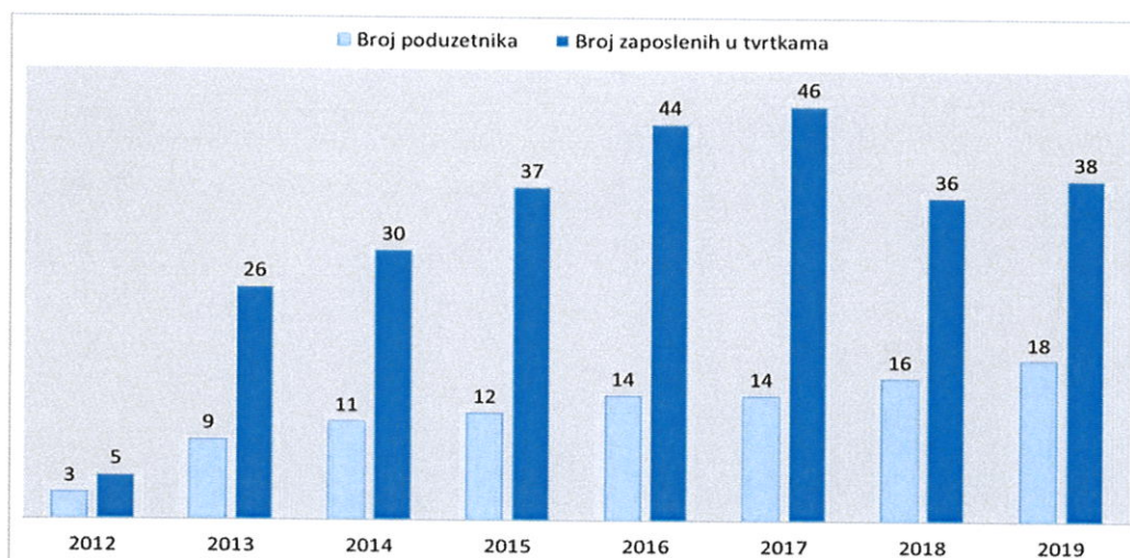
Slika 2. Pokazatelji učinkovitosti rada